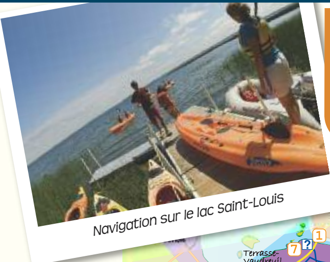
Navigation sur le lac Saint-Louis