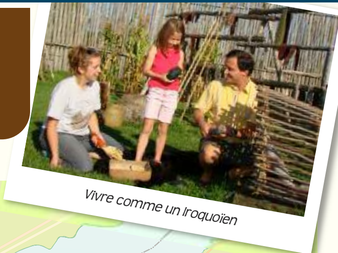
Vivre comme un Iroquoien

4 Admirez ce majestueux édifice érigé face au lac Saint-François. Couchers de soleil à couper le souffle.